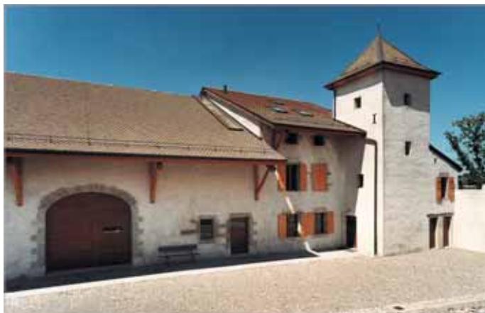
Entrée principale du musée par la porte de grange

De 1919 à 1988 les bâtiments de la ferme sont loués pour une activité agricole. Dès 1990 la Fondation décide de rénover et de donner une autre vocation aux bâtiments de la ferme. ►