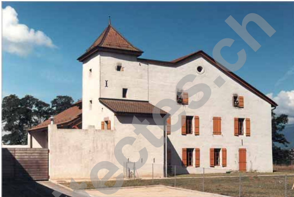
Ferme et Château