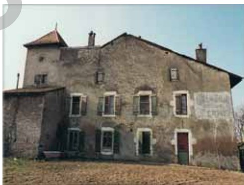
Vue avant rénovation