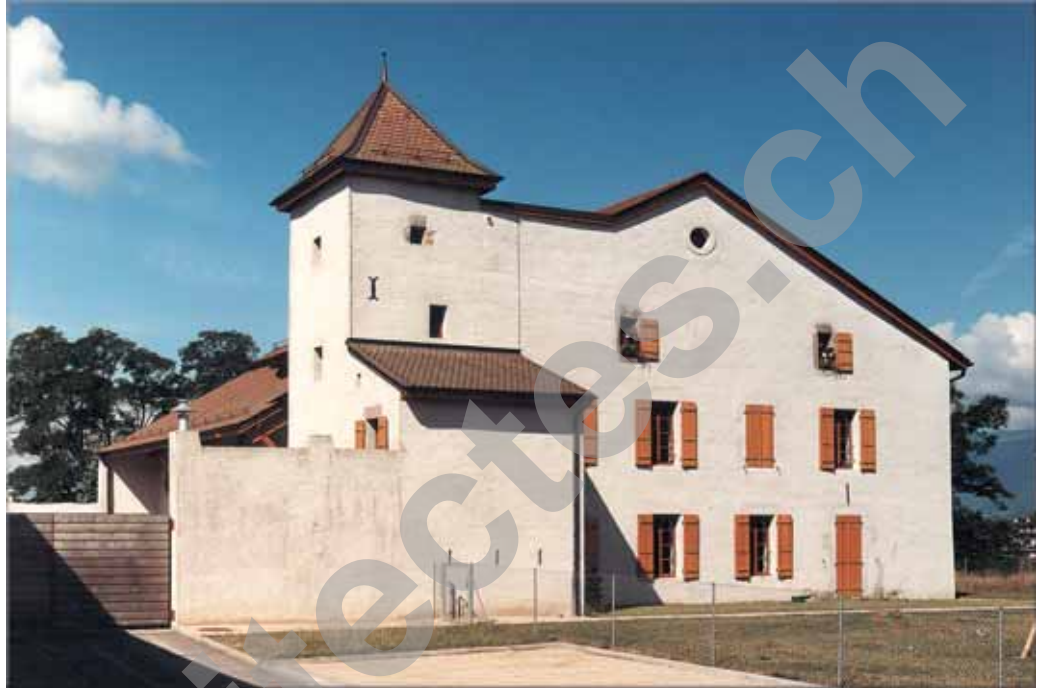
Ferme et Château