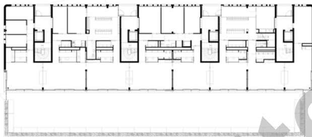
Plan niveau garderie