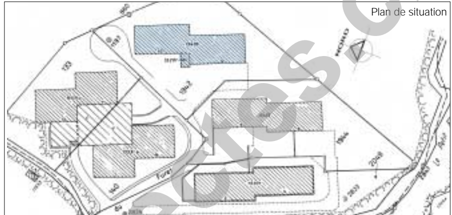
Plan de situation

Enfin, les aménagements extérieurs comprennent de nouvelles plantations ainsi qu'une remise en état du gazon existant.