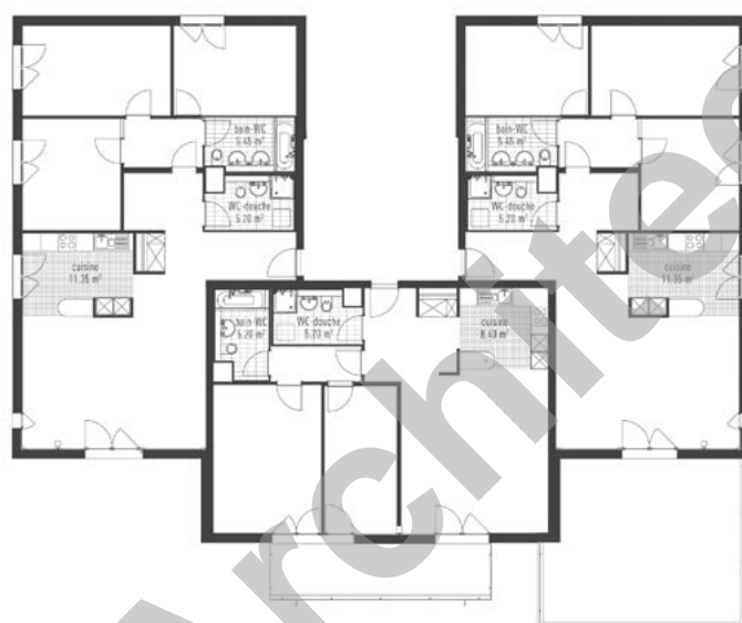
Plan du rez-de-chaussée, bât.D

puisse être réalisé en moins de deux ans, tout en gé- rant une organisation par étapes devant permettre aux locataires d'entrer dans leurs logements respectif, au fur et à mesure de la terminaison des bâtiments.