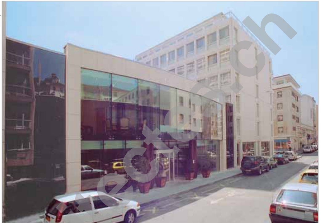
Vue de l'entrée