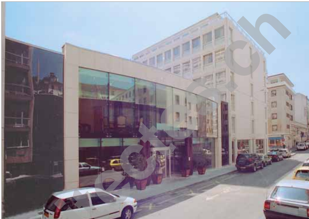
Vue de l'entrée