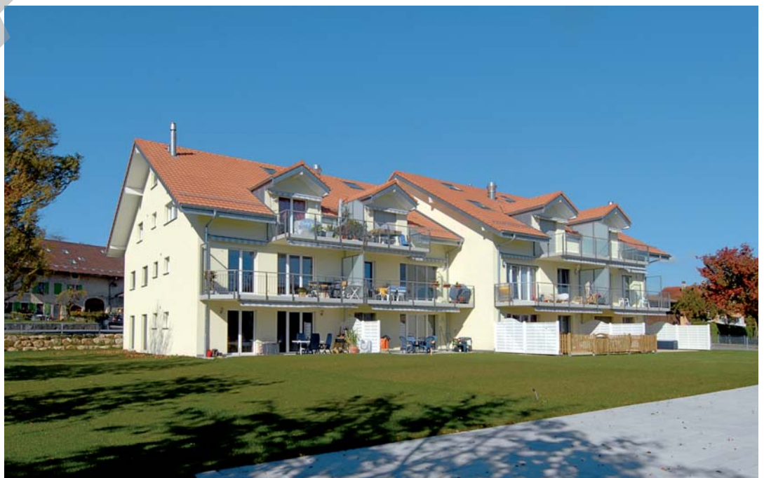
Image classique et de belle tenue: les immeubles présentent toutes les caractéristiques les plus courantes des constructions contemporaines de ce type.