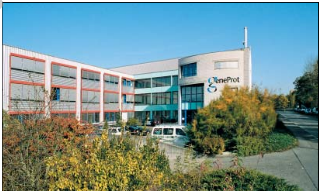
Image générale en accord avec les objectifs de l'entreprise et infrastructures techniques surdéveloppées constituent les éléments remarquables du bâtiment.